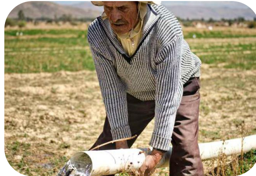
Fortalecimiento de la capacidad técnica del personal local y acompañamiento en el proceso.