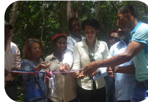
Modificación de los modelos de gestión del capital humano.