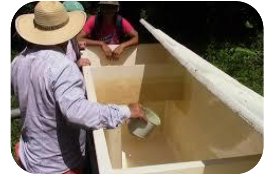
Procesos cíclicos de monitoreo y ajuste, según lecciones aprendidas en cada contexto.