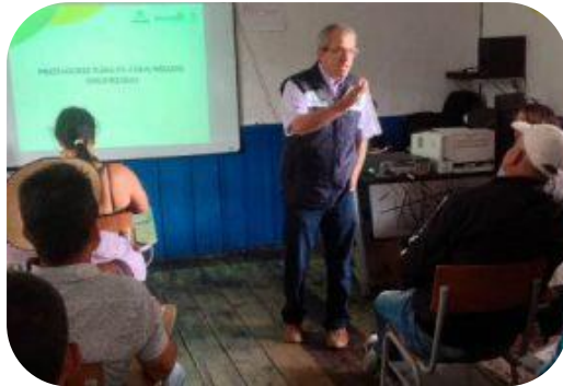
Tiempos para la transición.